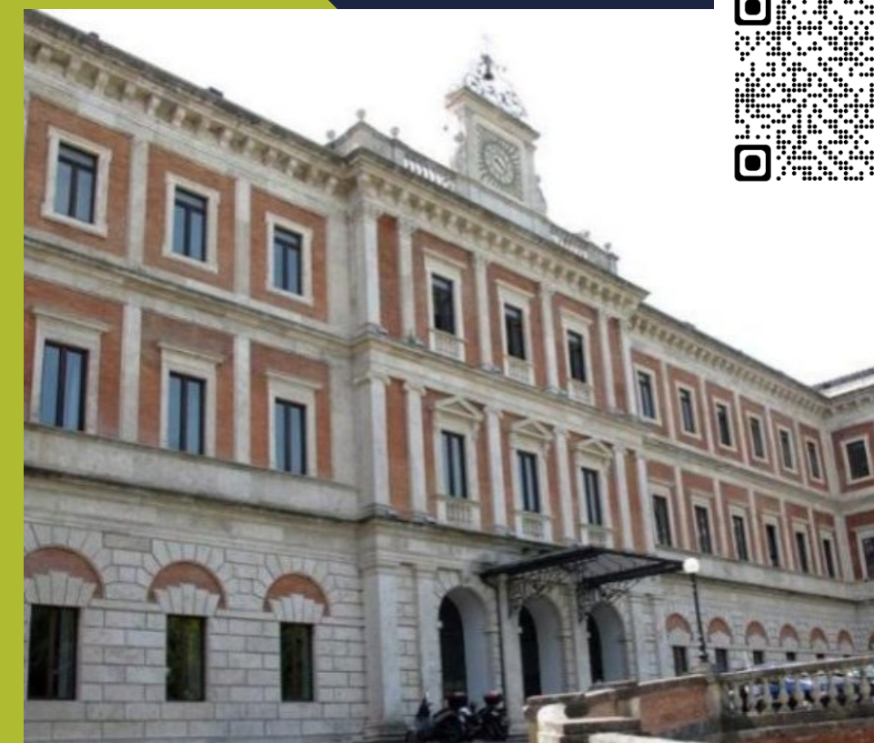
Complesso San Niccolò, Università degli studi di Siena